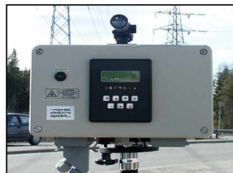
Monitor mit Bedienertastatur