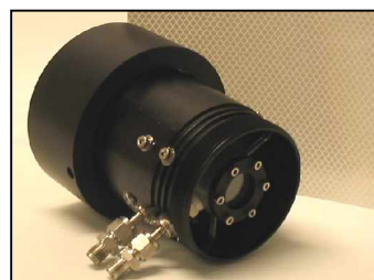
Testzelle zur Systemverifizierung