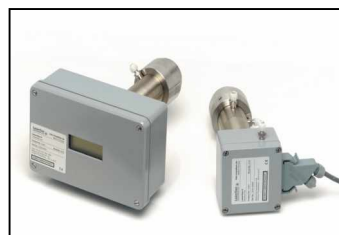
LaserGas II Single Path Monitor für kurze Messpfade oder zur In-Situ Gasanalyse in Kanälen, Rohren, Kaminen